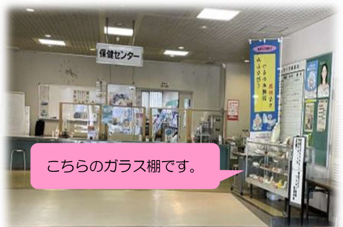
こちらのガラス棚です。

1歳から1歳半にかけての離乳完了期。うちの子は食べすぎ!?食が細い!?ネットや本で見てもいまいち量などの目安が分かりにくい。そんな時は保健センターの食品サンプルが実物大でとても参考になります。「だいたいこのくらいの量が目安だね。」「食事内容や間食ってこんな感じだね。」と、健診の時や近くを通った際に覗いてみてください。中央保健センター受付のすぐ右側にあります。中央保健センターでは栄養士に直接相談することもできます。気軽にお問合せください。TEL0898-36-1533